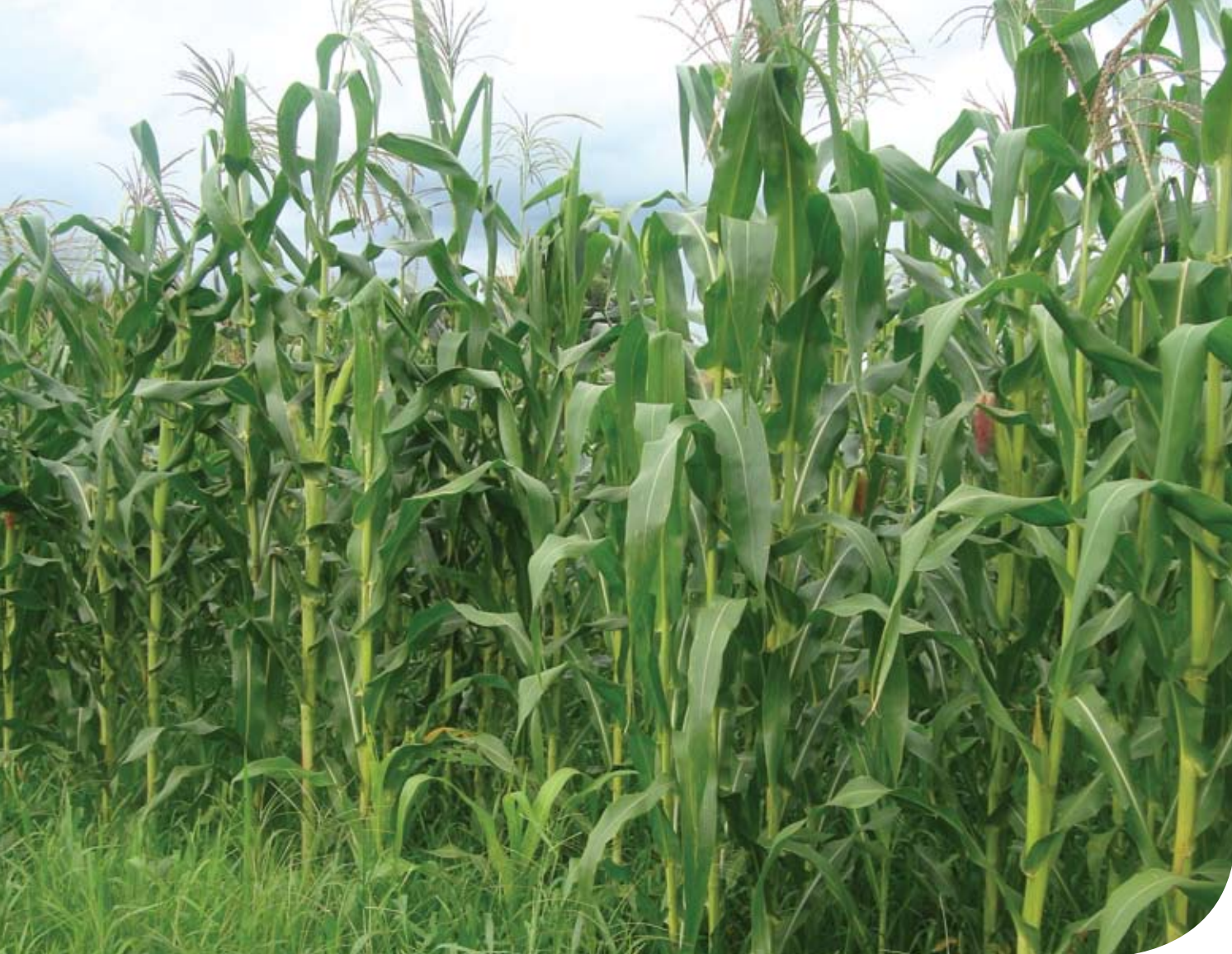
Aspecto de lavoura de milho em início da transição agroecológica, Irineópolis, 1ª quinzena de março de 2009

se tem notícia de que essas quebras de safra obrigarão várias famílias da região a venderem terras para saldar dívidas contraídas para o custeio das lavouras.