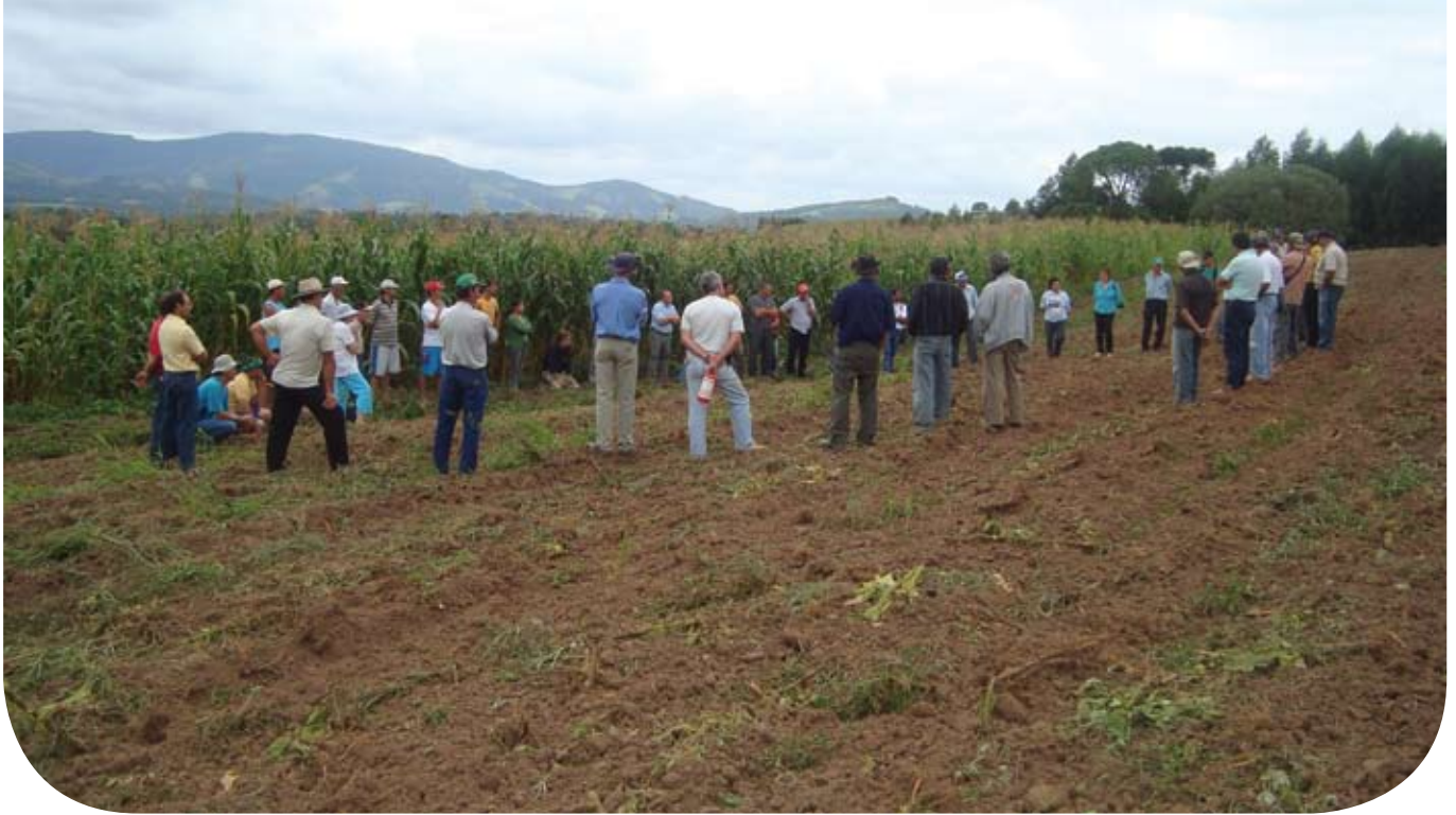
Encontro de agricultores(as) experimentadores(as) para avaliação e debate sobre resultados produtivos e econômicos das lavouras de milho em transição agroecológica, em Irineópolis, março 2009