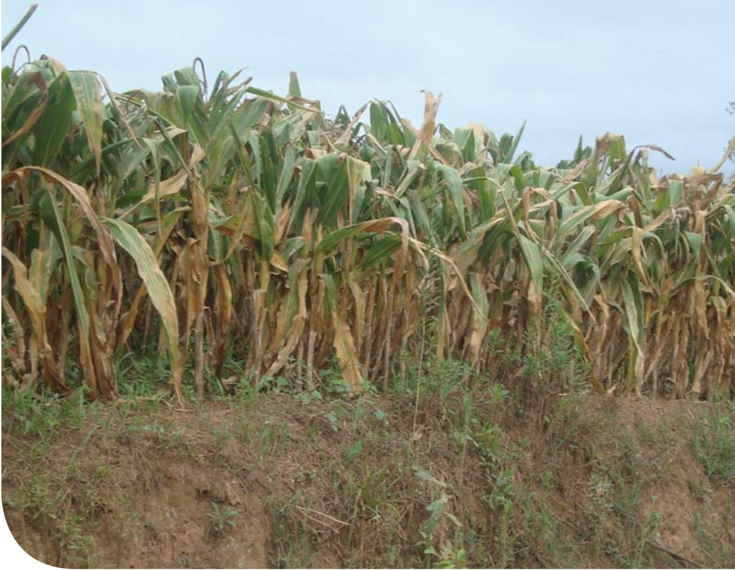
Aspecto de lavoura de milho cultivado em sistema convencional, Irineópolis, 1ª quinzena de março de 2009

nômico positivo de quase 3,5 mil kg/ha (ver Gráfico 1).